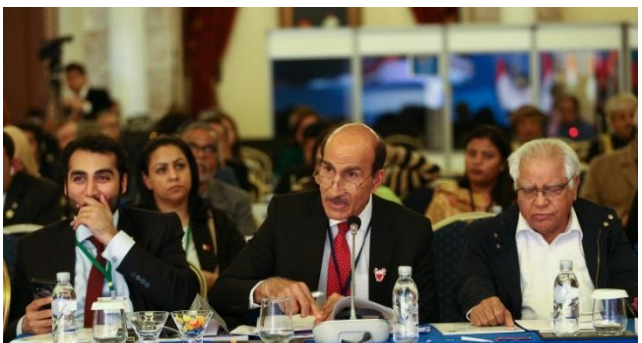
บรรยากาศของการประชุมสมัชชาใหญ่สมัชชารัฐสภาเอเชีย ครั้งที่ ๑๒ ระหว่างวันที่ ๑๔-๑๗ ธันวาคม ๒๕๖๒ ณ เมืองอันทาลีเย (Antalya) สาธารณรัฐตุรกี