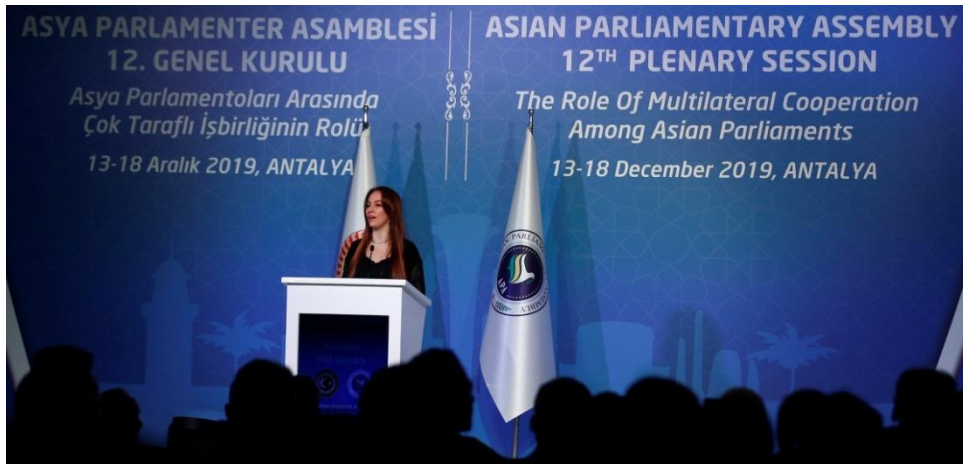
นาง Gabriela Cuevas BARRON ประธานสหภาพรัฐสภา กล่าวในพิธีเปิดการประชุมสมัชชาใหญ่สมัชชารัฐสภาเอเชีย ครั้งที่ ๑๒ วันที่ ๑๔ ธันวาคม ๒๕๖๒