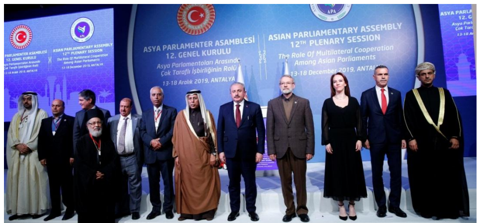
คณะผู้แทนรัฐสภาสมาชิกสมัชชารัฐสภาเอเชียถ่ายภาพร่วมกัน ในโอกาสการประชุมคณะมนตรีบริหารของสมัชชารัฐสภาเอเชีย ครั้งที่ ๒ และการประชุมสมัชชาใหญ่สมัชชารัฐสภาเอเชีย ครั้งที่ ๑๒ วันที่ ๑๔ ธันวาคม ๒๕๖๒ ณ เมืองอันทาลีเย สาธารณรัฐตุรกี