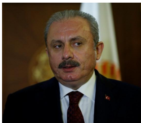
นาย Mustafa ŞENTOP ประธานรัฐสภาสาธารณรัฐตุรกี ประธานสมัชชาใหญ่สมัชชารัฐสภาเอเชีย กล่าวต้อนรับผู้เข้าร่วมการประชุมในพิธีเปิดการประชุมสมัชชาใหญ่สมัชชารัฐสภาเอเชีย ครั้งที่ ๑๒ วันที่ ๑๔ ธันวาคม ๒๕๖๒