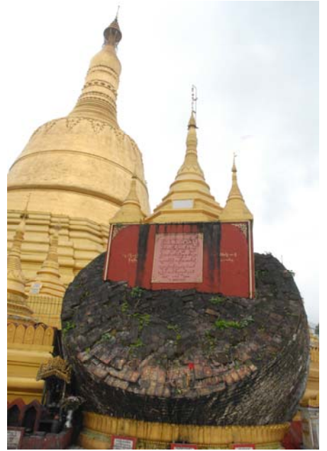
พระธาตุมุเตา เมืองหงสาวดี