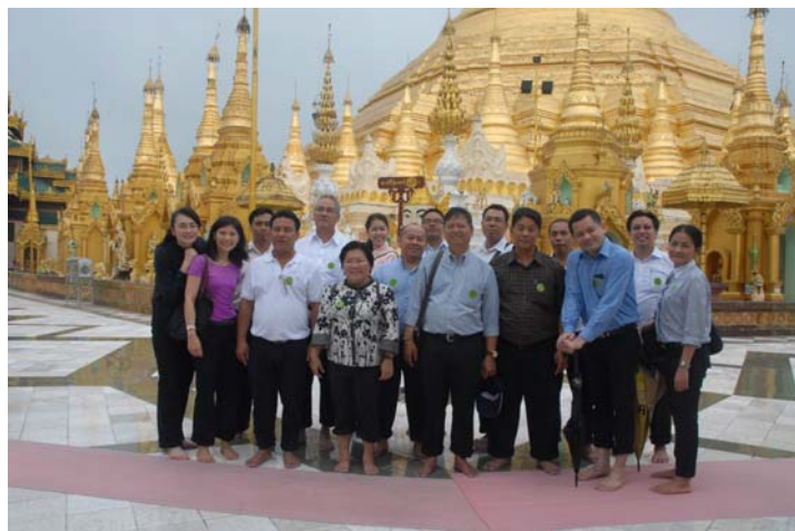
คณะฯ สักการะพระมหาเจดีย์ชเวดากอง เมืองย่างกุ้ง

คณะฯ ได้เยี่ยมชมสถานที่สำคัญทางประวัติศาสตร์และศาสนสถานที่สำคัญของเมียนมาร์ในเมืองต่างๆ อาทิ พระมหาเจดีย์ชเวดากองแห่งเมืองย่างกุ้ง พระมหาเจดีย์ชเวดากองจำลองแห่งกรุงเนปิดอร์ เจดีย์เวชันทอว์ เจดีย์เก้ามูคองแห่งเมืองตองอู พระธาตุนิรทรวานแห่งเมืองไจ้ต๋โท พระธาตุมุเตาแห่งเมืองหงสาวดี เป็นต้น