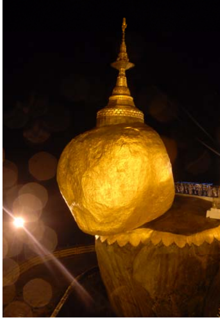
พระธาตุนิรันธรแขวน เมืองใจต์ทีโย