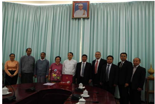
คณะฯ พบปะหารือกับนายอ่อง ลิน อธิบดีกรมอาเซียน ณ กระทรวงการต่างประเทศ กรุงเนปิดอร์