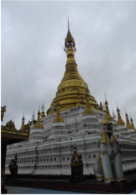
เจดีย์เก้ามุดอว์ เมืองตองอู