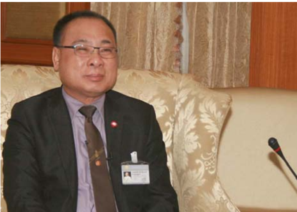
โครงการ “หนีท้าว หว่อไต้หวัน”

ฉบับที่ ๕๒๐ ประจำปีที่ ๑๗ - ๒๘ เมษายน ๒๕๕๖