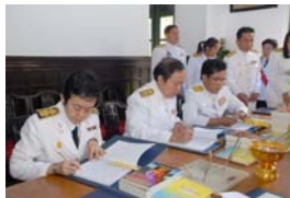
ลงนามถวายพระพรชัยมงคล