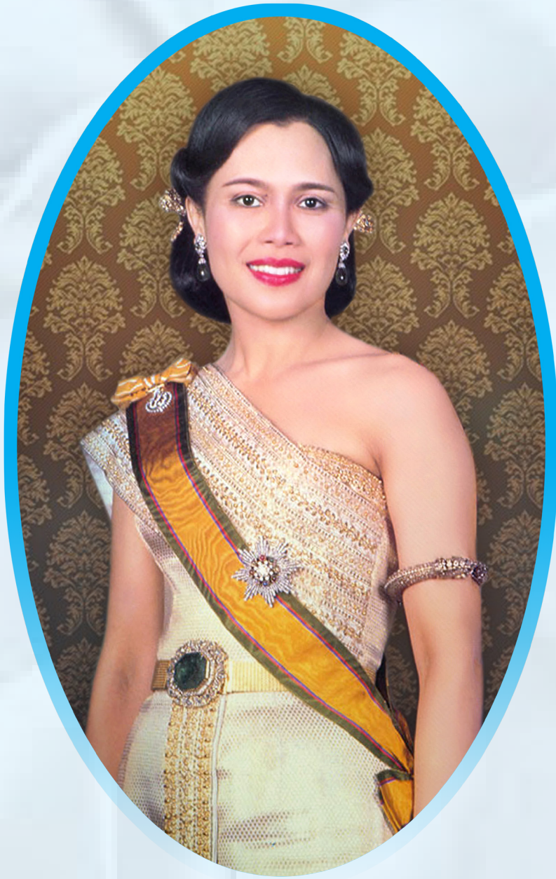
ที่มายกา ไหว้ มหาราชินี